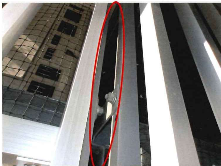
蝶番方向 室外機後方に隙間あり