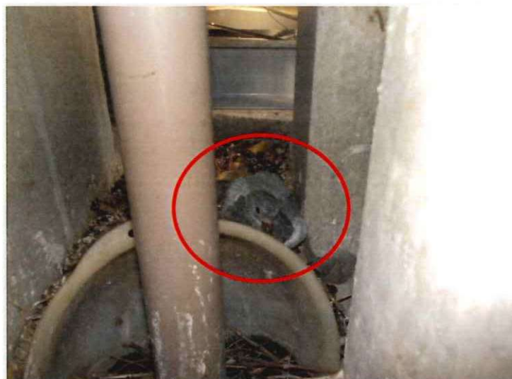
最奥部の排水路にヒナを確認