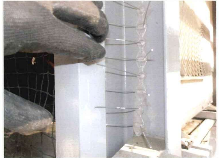
隙間 封鎖イメージ② 金属針タイプ