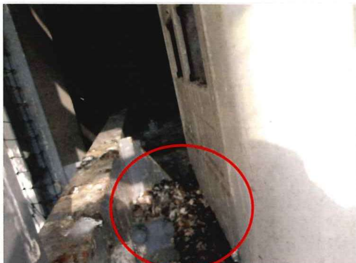
室外機横のハト糞