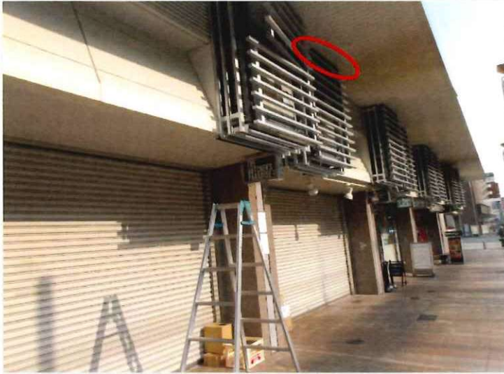
室外機設置スペース(13箇所) 格子最上部にハトがとまり、中へ入るのを確認