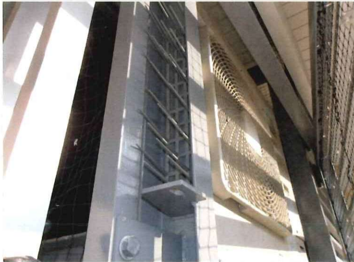
隙間 封鎖イメージ① 樹脂針タイプ